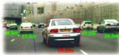
前方の車両・人物・車線を常にモニター 対象物までの距離と相対速度から “衝突までの時間”を計算