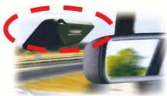
フロントガラスに カメラユニットを設置