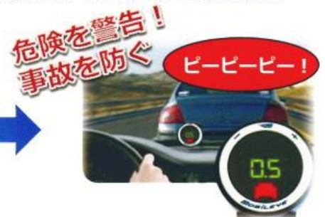
衝突の危険が迫るとアイコンと ピープ音で危険を警告！